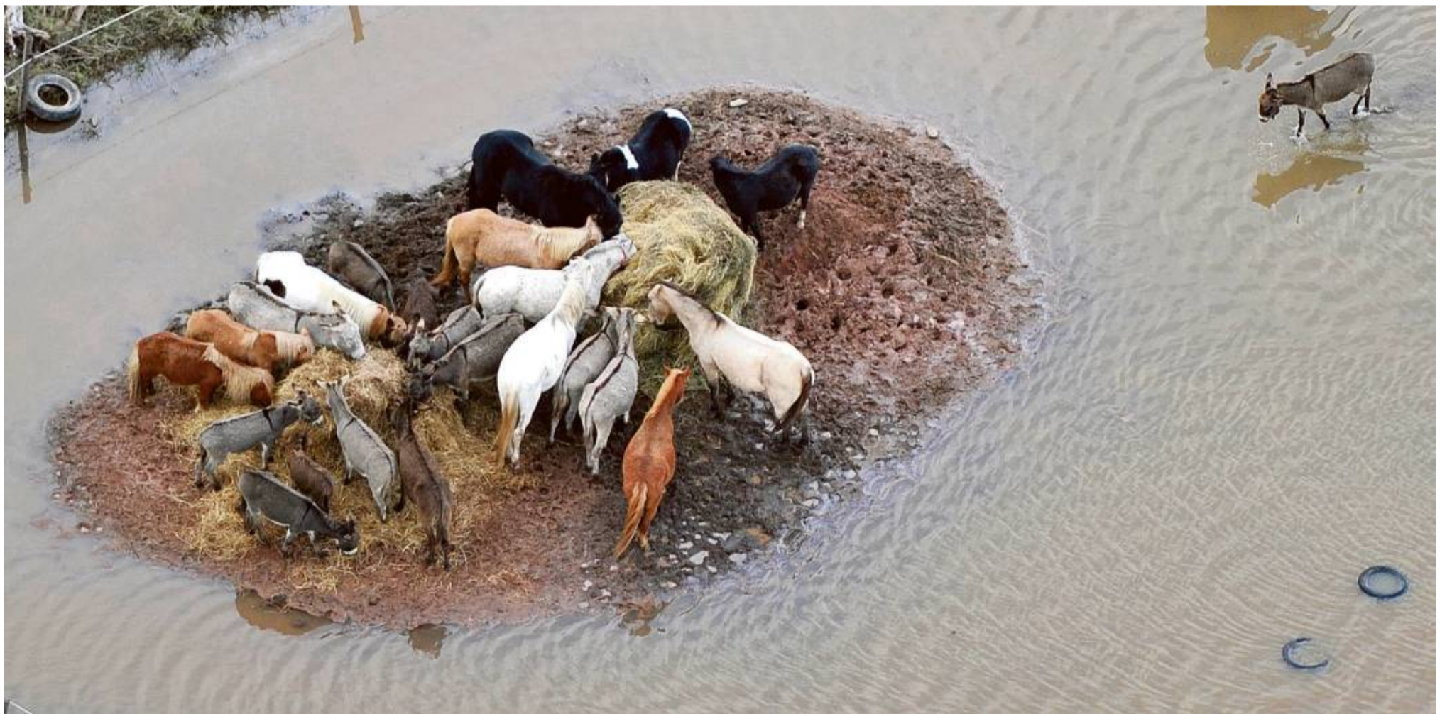
ROQUEBRUNE-SUR-ARGENS. Zware regenval leidde tot overstromingen in het zuidoosten van Frankrijk. Het vee wordt bijgedreven, mensen worden geëvacueerd.